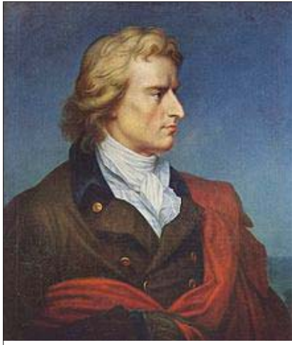
Фридрих фон Шилер

Шилер. Йохан Кристоф Фридрих фон Шилер е роден в бедно семейство през 1759 г. в Марбах, Германия. Първите си творби пише в учи-