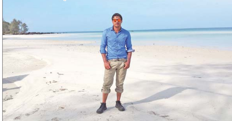
2014 г. - от остров Ко Ронг

каузи, като „Българската коледа“, на УНИЦЕФ, „Открито за диабета“, „Нощ на театрите“ и други. Човек не може и не трябва да остава встрани от обществения живот. Бил съм свидетел, когато в подкрепа на добро дело се правят събития в луксозни хотели и ресторанти, със скъпи куверти, продават се на търг скъпи