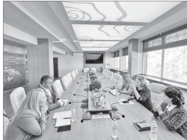
Срещата на представители на АПИ и Община Казанлък

По време на срещата е бил обсъден и въпросът за обезопасяване със стационарни камери на опасните кръстовища в частта от държавния път I5 при Шипка и Крън, тъй