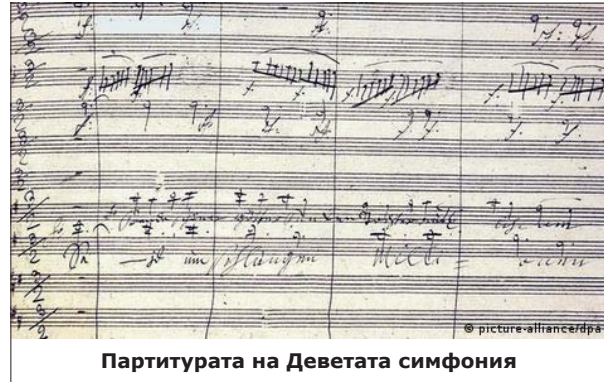
Партитурата на Деветата симфония

Творбата е без думи, защото в противен случай би възникнал въпросът на кой точно от европейските езици да се пее официалният химн. „Одата на радостта“, фрагмент от Деветата симфония на Бетовен, става символ на Съвета на Европа 20 години след основаването му през 1972 г. Тогава Съветът решава да поръча