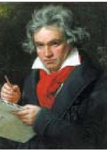
Лудвиг ван Бетовен

Деветата симфония. Тя е връх в творчеството на гениалния композитор. Симфонията узрявала дълго, почти през целия му живот. Бетовен се обръща към нея след десетгодишна пауза, когато е напълно огушал. На популярната поема на Шилер „Към радостта“ той попаднал 30 години по-рано. Първи опити за музика към текста напра-