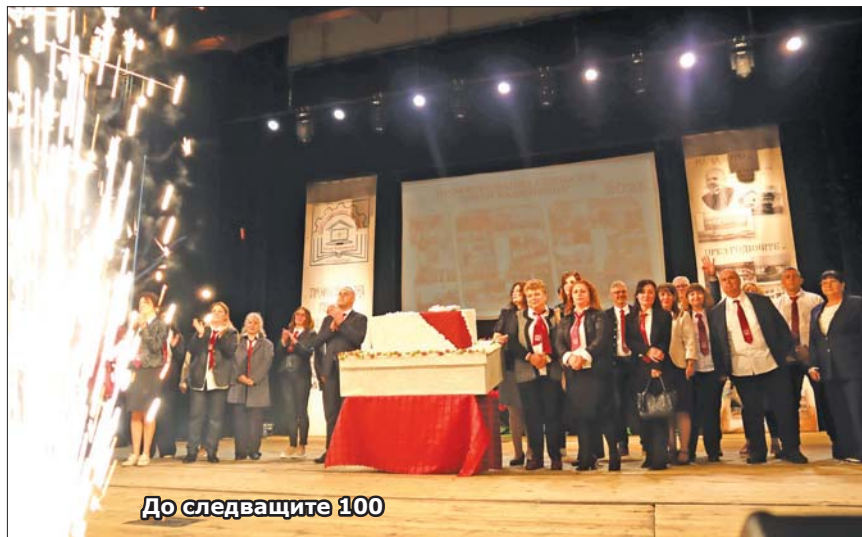
До следващите 100