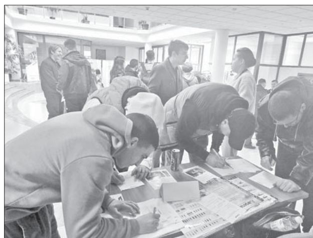
Дружеството привлече интереса на академичната младеж