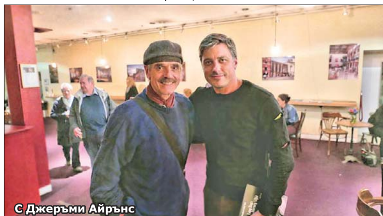
С Джеръми Айрънс

случки в живота ми през годините. Сещал съм се за тях и съм ги описал – някои са смешни, други тъжни. След обаждането се прибрах вкъщи и препрочетох отново тези разкази. Започнах да ги чета и действително видях, че в тях съществува някакъв друг човек, не точно този, който съм в момента. И си казах, че може би има някакъв смисъл да се види как един човек се променя във времето и как през различните му периоди се подменят мечтите,