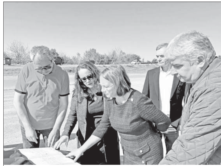
Стартира проектът за кръговото кръстовище

„При този обект най-важно след качеството на изпълнение е безопасността на преминаване на всички 80 000 жители на общината, защото този транспортен възел няма да се затваря изцяло по време на строителството. Ще бъдем безкомпромисни в контрола на обекта“, заяви кметът Стоянова при старта на дейностите. Представителите на бизнеса, по чиято инициатива започва ремонтът, изказаха удовлетворение, че стартира работата по проекта, който