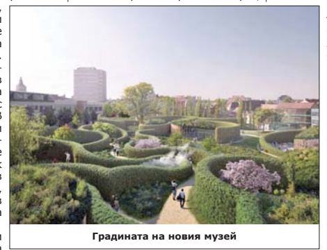
Градината на новия музей

Последната спирка на писателя по нашите земи бил Видин. Слязъл на пристанището, но не можел да влезе в града – корабът идвал от Константинопол, където имало епидемия. За да не предесе треска или чума,