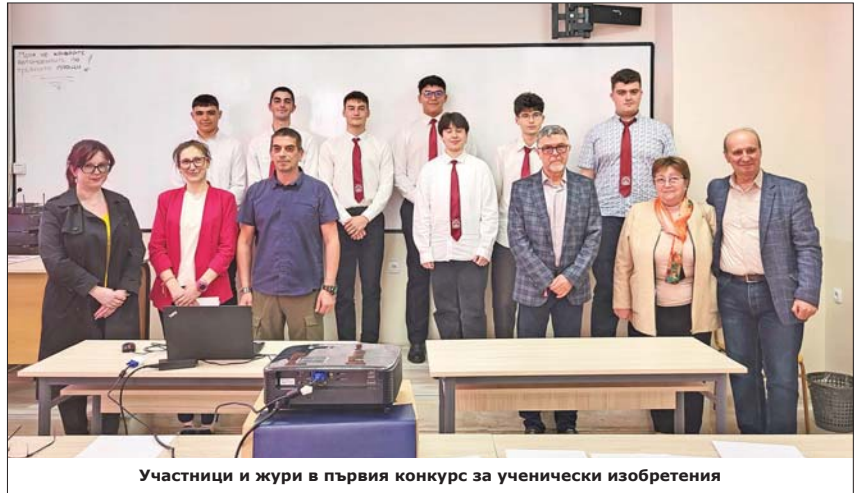
Участници и жури в първия конкурс за ученически изобретения