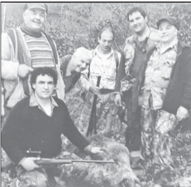
Преди години с ловната дружинка

мат и студа, стигащ до минус 30-40 градуса, той никога няма да забрави екскурзията до Москва и впечатляващия Червен площад.