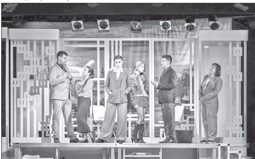
Сцена от новия спектакъл на театър „Любомир Кабакчиев“

то пускаха на всяка Нова година, също така „Служебен роман“ и „Гара за двама“. Интересното за тези заглавия е, че те първо се появяват като театрални постановки, а по-късно са екранизирани. Двамата решават, че многобройните театри в СССР имат нужда от комедии, които пряко