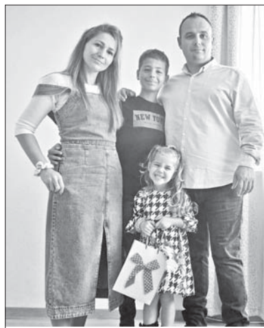
Цялата фамилия на Мехмед е арсеналска

от времето, когато е работил в туристическия бранш. Дет-