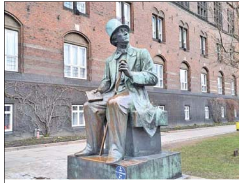
Първият паметник на Андерсен, издигнат му приживе

прелестните огради от червенокафява пръст, красивите долини, прекрасния табун от черни коне... Когато пред погледа му се открил „важният български град Русчук“ / Русе/, останал възхитен от къщите, градините и многобройните минарета: „Човешка ръка ги е сътворила!“! След това възхищението му се превърнало върху Свищов и Никопол, Оряхово и Лом, най-вече върху природата: „Прекрасна планинска земя, величието ти подтиква душата към всоудайност!“.