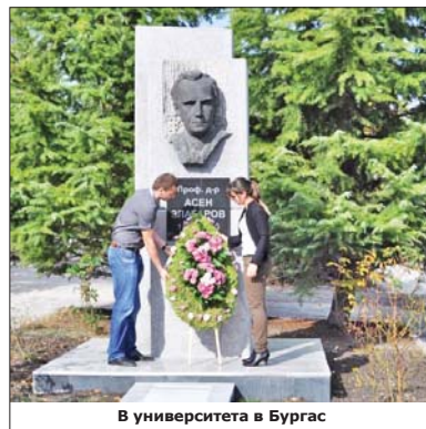
В университета в Бургас