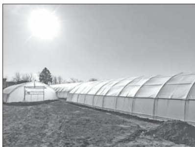
Общинските оранжерии в с. Долно Изворово

тикви, а занаят се мисли за създаването на овощна градина.