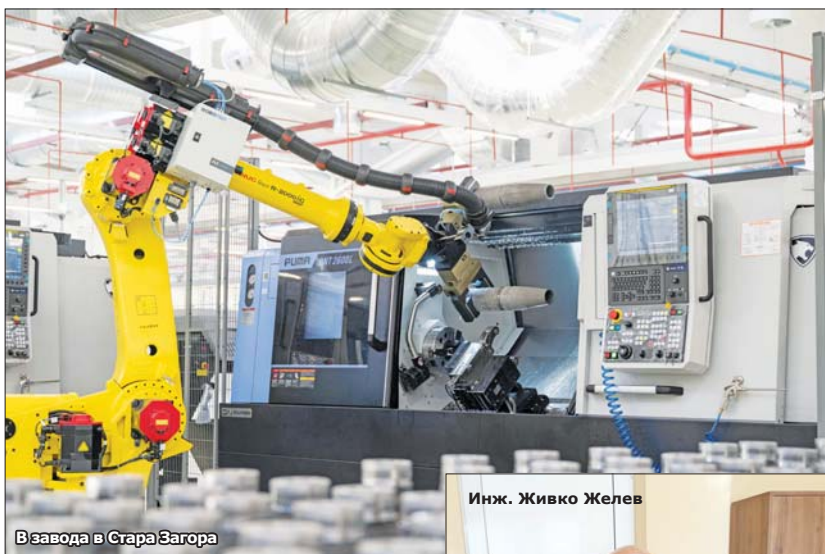
В завода в Стара Загора

ТОВА КАЗВА ИНЖ. ЖИВКО ЖЕЛЕВ, РЪКОВОДИТЕЛ НА ОБОСОБЕНОТО ПРОИЗВОДСТВО НА ЗАВОДА НА „АРСЕНАЛ“ В СТАРА ЗАГОРА