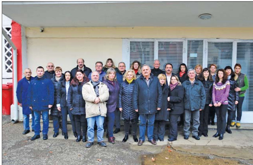
Снимка на екипа на БРВ-Б, направена през 2019 г., когато базата навърши 10 години от своето създаване