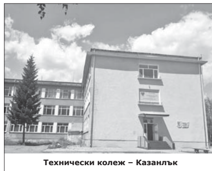
Технически колеж – Казанлък

Важен момент от обучението е курсовият проект, който създава у студентите навики за цялостно изготвяне на прецизна конструкторска документация на проектиран механизъм, както и подход за самостоятелна работа и защита на взетите решения.