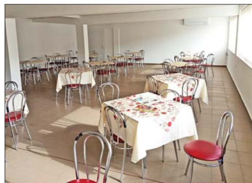
Оборудвана е столовата, скоро ще има и осигурена храна на база кетъринг

положена обзаведена столова, оборудвана с хладилник, фурна и микровълнова печка. Планира се скоро да им бъде осигурен кетъринг, за да могат да ползват една от важните социални придобивки в „Арсенал“ – да се хранят на преференциални цени, както колегите им от другите структури на дружеството в Казанлък и Мъглиж.