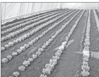
Първите зеленчуци вече са засадени