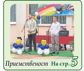
Примствено На стр. 5