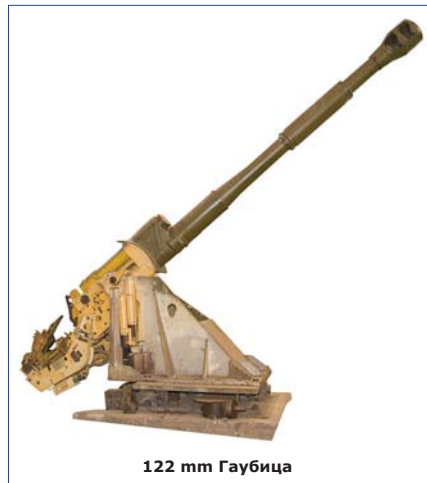
122 mm Гаубица

различни нововъведения – собствени разработки. В Завод 1 за първи път е внедрена агрегатна машина с електронно управление – АМ 0164 . Внедрен е и реле-кулономер за електронно дозиране на електричеството при обработката на детайлите. В Завод 2 започва да работи автомат за контролиране отворите на едно от изделия-