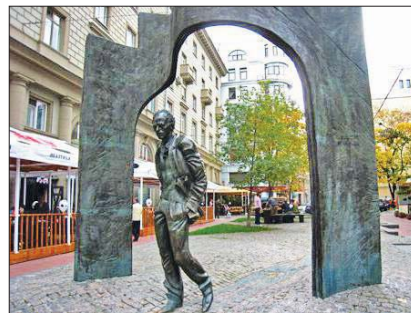
Монумент на Булат Окуджавата на ул. „Арбат“ в Москва

характер. Често му предлагали да остане в чужбина, но той не можел да си представи живота извън родината си. Бил много влюбчив. Възпявал жените в стиховете си, а те му отвръ-