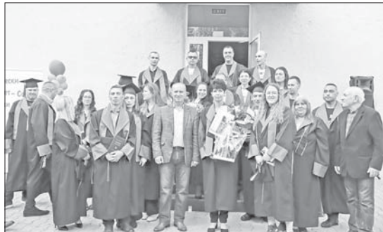
Арсеналци са основната част от Випуск '2023 на Технически колеж - Казанлък