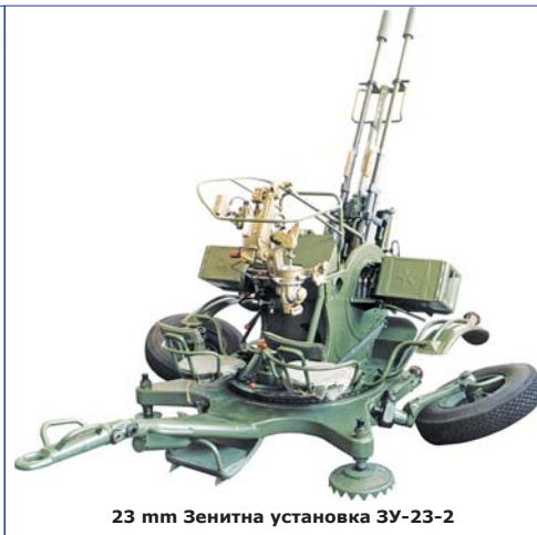
23 mm Зенитна установка ЗУ-23-2

чава наградата „Златни ръце“ – за гамата си агрегатни възли. През 1980 г. прототипът на обработващия център на модел ЦМ522.61 е оценен като върхово постижение в българското машиностроене и на панаира в Пловдив е отличен със златен медал . А през 1982 г. машината модел ТНС131 е отличена със златен медал и почетен диплом