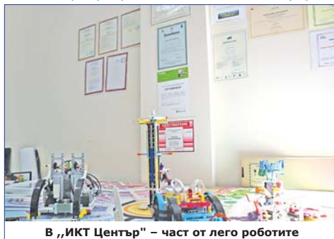
В „ИКТ Център“ – част от легио роботите

различни интереси, хобита и изкуства“. Отборите отоваряха на