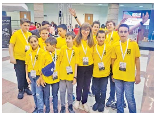
След успешното представяне на световния фестивал