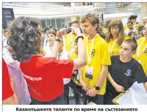
Казанлъшките таланти по време на състезанието

Отборите ни по роботика Cyber Robo, Robo Clan и най-младият ни Robo Giga се готвят за националното „Роботика за България“, което се организира от SAP Labs Bulgaria и ФРГИ. Преди финала има три предварителни кръга онлайн. По традиция финалът на състезанието се провежда в столицата. Вторият финал на състезанието по програмиране