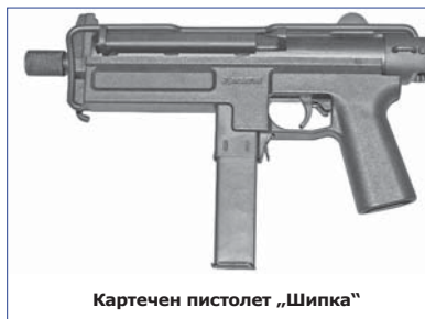
Картучен пистолет „Шипка“

Своите постижения и възможности казанлъшката оръжейница пренася върху промишлеността в цялата страна. Част от нейната продукция се превръща в основно производство на новосъздадени крупни предприятия, заемащи важно място в родното машиностроене. От завода в Казанлък се раждат: Завод „Георги Димитров“ – Русе, ЗММ – София, Завод „Мадара“ – Шумен, Завод „Методи Шатаров“ – Пазарджик, Силнотоковият завод „Васил Коларов“ – София, Заводът за дизелови мото-