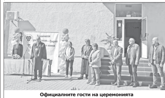
Официалните гости на церемонията