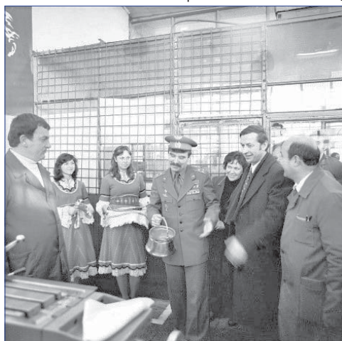
Космонавтът Георги Иванов – гост на комбината

Скъпи гости на колектива през 1979 г. са и кап.