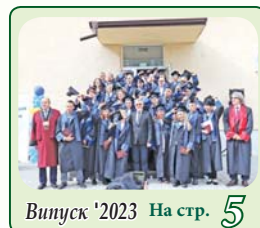
Выпуск '2023 На стр. 5