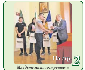
На стр. 2 Младите машиностроители