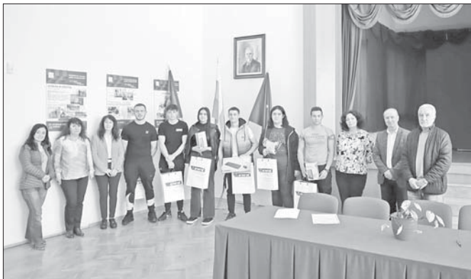
Второто издание на „Арсенал“ – дом за ДОМИНО“ завърши с тържествено награждаване на най-добрите