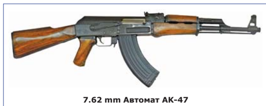
7.62 mm Автомат АК-47