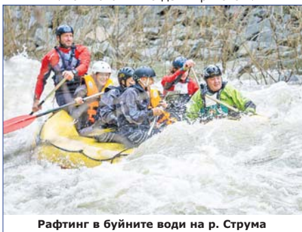
Рафтинг в буйните води на р. Струма

- В началото започнах като технолог в НИТИ, после станах началник-отдел и ръководител-направление.