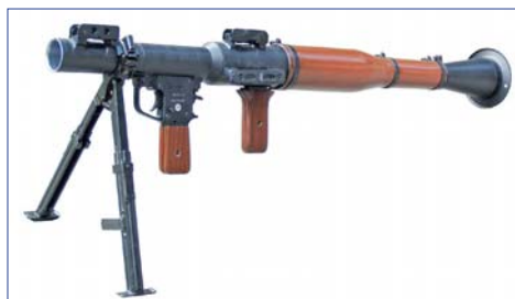
40 mm Ръчен противотанков гранатомет РПГ-7

През 1965 г. започва ускореното изграждане