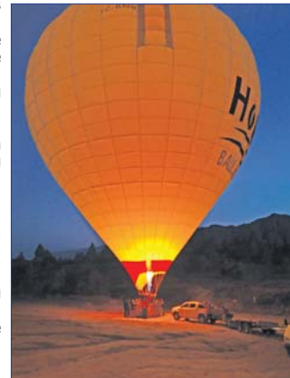
Кападокия - невероятното приключение с балон