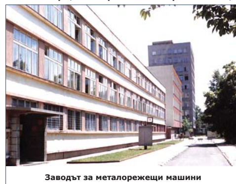
Заводът за металорежещи машини

Създадени са: Съвет по качеството; Методическо бюро – за повишаване на квалификацията; Местна противовъздушна отбрана; Централен технически съвет; Научно-техническо дружество , техническият кабинет на завода става национален първенец; Отдел „Труд и работна заплата“; Помирителна комисия; Конструктивно-технологичен отдел; Енергиен отдел; 10 планово-диспечерски бюра; Експериментална работилница;