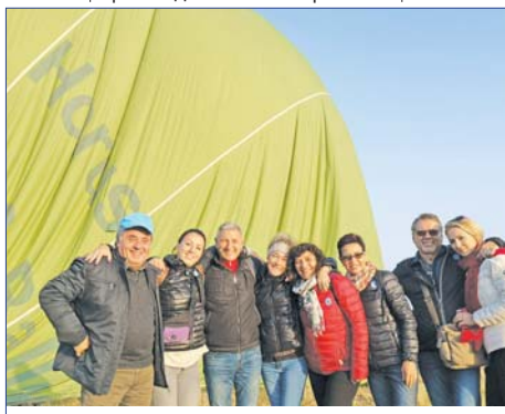
Споделени емоции с колеги

Завод 4 в Мъглиж. През 2000 година станах технически директор на завода, а през 2011-а бях назначен за негов директор. Когато постъпих в Завод 4, започнахме да преустройваме завода и да произвеждаме много повече и различна продукция от специалното производ-