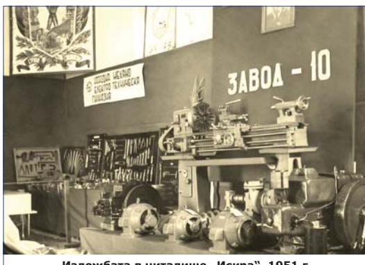
Изложбата в читалище „Искра“, 1951 г.

През 1960 г. е открит Цехът за твърдосплавни пластини . Година по-късно в новопостроения по-голям цех започва непозната