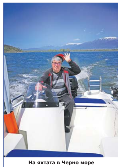
На яхтата в Черно море

Имам 54 корена лози и 24 сорта грозде. Сам си правя виното. Печелил съм първо място на конкурс. Майсторлъкът включва целия процес - от саденето на лозата до залепването на етикетата на бутилките. На моя рожден ден, на който, оказа се, съм поканил толкова хора, на