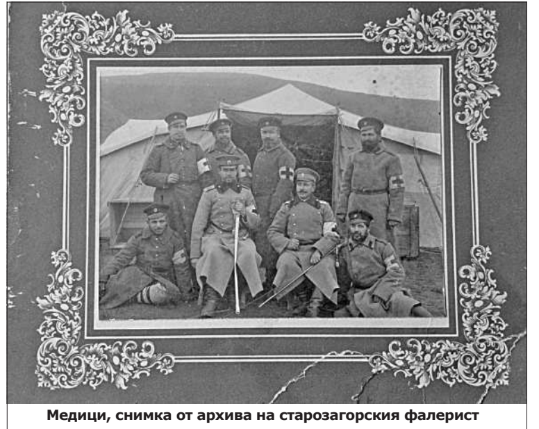
Медици, снимка от архива на старозагорския фалерист

има номер. Така издирването става по-лесно. При нас обаче няма такава практика и колекционерите и специалистите трябва да положат