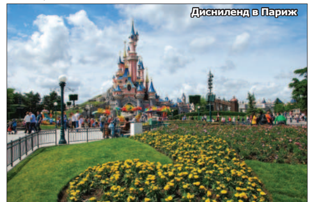
Дисниленд в Париж

Увеселителните паркове. Уолт Дисни имал една дръзка мечта – да създаде парк с атракции, в който децата да са обкръжени от любимите си Дисни-герои. Паркът-мечта трябвало да изглежда „като нищо друго на света“. Построен върху 70 хектара земя близо до Лос Анджелис, той отваря врати през 1955 г. Впечатлявал не само с мащабите, а и с техническите си възможности. Откриването било излъчено по телевизията. Били поканени 11 000 души, но дошли 30 000. Само за две години посетителите достигнали 1 милион, а през първите три десетилетия паркът забавлявал повече от 250 мили-