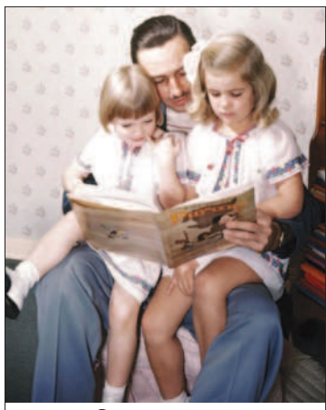
С дъщерите си

Мики Маус. Уолт Дисни панически се боял от мишки. Веднъж