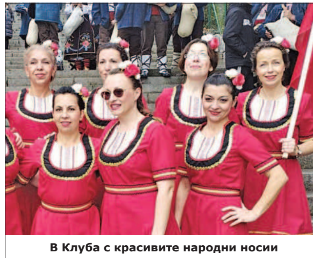
В Клуба с красивите народни носии