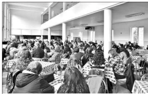
Отчетно-изборно събрание на ВСК „Арсенал“

Към 15 май 2023 година членовете на ВСК „Арсенал“ са 3448, като от 1 януари до 15 май тази година броят им е нараснал с 320. Също към 15