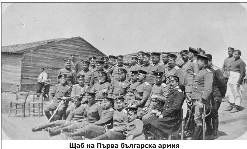
Щаб на Първа българска армия