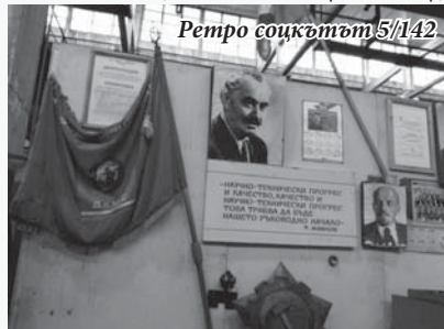
Ретро соцкътът 5/142

на универсални фрези сега събира монтажници за тях – те се грижат за изправността на над 250 универсални фрези, които са в експлоатация на територията на дружеството.