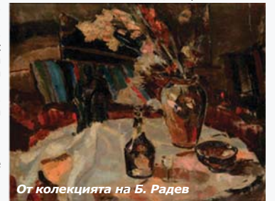
От колекцията на Б. Радев