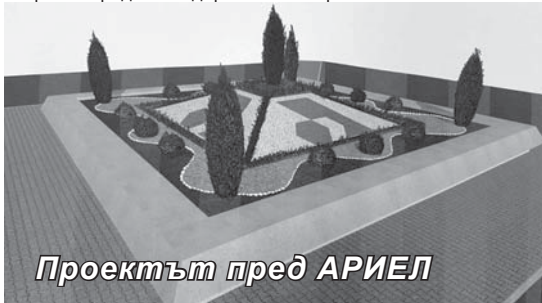
Проектът пред АРИЕЛ

ление. За ценните уроци в работата си е благодарен, както на