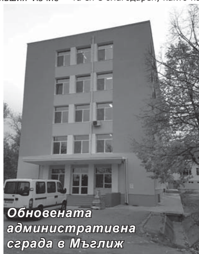
Обновената административна сграда в Мъглиж