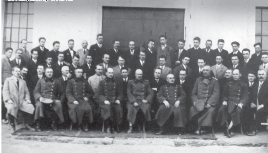
Административно-техническото ръководство на фабриката при изпращането на ген. Димитър Стоенчев

говорността по дислоцирането на фабриката.