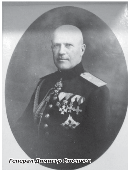
Генерал Димитър Стоенчев

Ген. Димитър Стоенчев е един от скромните, честни и достойни офицери в Българската армия. Съвремен-