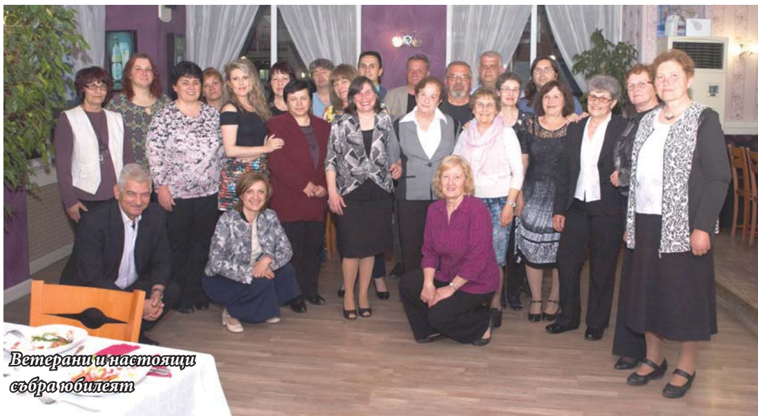
Ветерани и настоящи събра юбилеят

Звено „Проектиране“ към направление „Проектиране, инвестиции и строителство“ - „Арсенал“ стана на 50 години