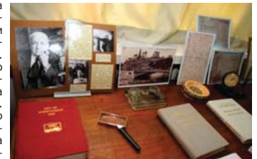
Кабинетът на акад. Наджак

признават Приоритета на българина. Развиват се научни школи - в СССР и САЩ, в Япония, Бразилия, Индия. Фотоелектретното състояние става основа за развитието на копирната индустрия. То намира огромно практическо приложение и в областта на безкакумната телевизионна техника, при запаметяващите устройства, рентгеновите дозиметри и при снимки от космически спътници. През 1981 г. откритието е вписано под №1 в Държавния регистър на откритията и изобретенията в България. „Изчкавах, - обяснил