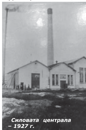
Силовата централа - 1927 г.

17-ти випуск на Военното училище на Негово Княжеско Височество. Произведен е в чин поручик през 1900 г. Още съ-