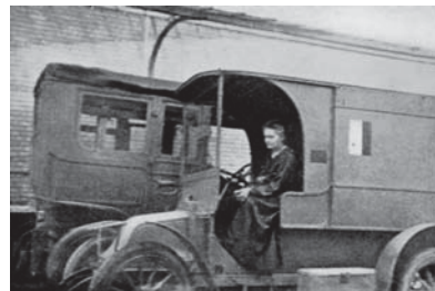
Първата мобилна рентгенова лаборатория на М. Кюри

През 1910 г. Мария Кюри опередяла атомното тегло на радия и мястото му в таблицата на химичните елементи. Изработила международен стандарт за опередяне на радия, публикувала фундаменталния си научен труд за радиоактивността, под влияние на който впечатляващ