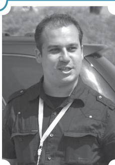
600 хиляди лева годишно.

Да, ще се случи. Живеем в един много обременен исторически и политически регион. Но за наша радост този здрав корен, който имаме, е засегнат, но не е засегнат до степен, че дървото безвъзвратно да изсъхне. Но, ако не започнем да се грижим за дървото и за корена му, наистина тази опасност съществува. И фактът, че толкова много хора вече идват на Шипка, означава, че това е важно за хората. Мисля си, че българинът в масата си иска да види поне мъничко добри примери за подражание, тогава нещата биха поели в една съвсем друга посока. Убеден съм, че в страната ни ежедневно има хиляди българи, които правят мислени неща, които обаче никой не показва. За съжаление. Не можем да видим светлото. Примерно, колко пъти по обществено значими въпроси и теми Българската православна църква е излязла и заявила своето становище, позиция? Това го няма у нас. Напълно е друго: ето, Ватиканът излезе, папата изказа отношението на църквата за концерта на Мадона. „Не сме съгласни“, макар че Мадона пак пая. Трябва да започнем да показваме доброто, защото в противен случай нищо добро не ни чака. А стават хубави неща.