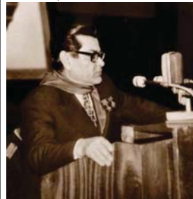
1973 г. Алексей Мересиев говори пред жителите на Варна

През 1973 г. летецът гостува в нашата страна. Сред гравеите, които е посетил, са Варна и Стара Загора, където през 2016 г., вкл. и чрез интернет връзка с гр. Камишин, бе чествана 100-годишнината от рождението му. В курорта „Дружба“ с героя от войната се срещнал журналистът Радомир Медникарков.