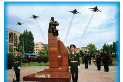
Паметник на Алексей Мересиев в родния му град

Той обядвал на една маса с тъмнокос мъж. Изразителните му очи издавали непоколебимия му характер. Заговорили и Медникарков разбрал, че пред него стои самият Алексей Мересиев, който с подвизите си смяял света. В този необикновен човек нямало капка високомерие. Поразходили се. Погледът на журналиста попаднал на краката на госта, скрити под съветъл панталон. С протезите той ходел свободно, без бастун. Уловил учудения поглед на българина, Мересиев сам го извадил от неудобството. Журналистът го попитал как е преживял такъв стрес. „Трябва да призная, облях се в пот, - отговори Мересиев, - аз съм живо същество, и аз имам инстинкт за самосъхранение. В неравния бой с няколко самолета те връхлетяха върху мен. Бях свален. Паднах в един пресечен терен. Оттук започнаха мъките ми“. Казал си: трябва да оцелея! „Имах късмет. А и хирургите се справиха“. „А след това?“, попитал Медникарков. „Въпреки забраната, не се отказах да се бия. Маркар и изкуствени, краката ми си вършеха работата“. На въпроса дали Б. Полевой върно е отразил всичко в повестта си, Мересиев отговорил: „Като писател може да е сложил малко украса, но всичко, което е написал, е самата истина“.