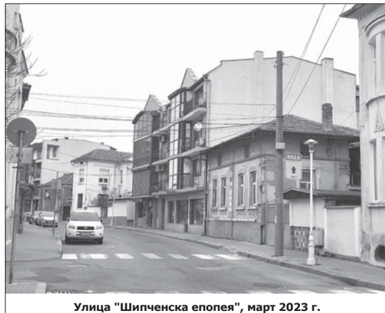
Улица „Шипченска епопея“, март 2023 г.

След 9 септември 1944 г. казанлъшките евреи се завръщат в града, с разсипано имущество, но щастливи, че са живи. Новата власт обаче също им съз-