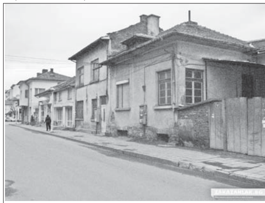
Последните еврейски къщи по ул. „Шипченска епопея“, март 2016 г.

Качвайки се на влака, евреите плачат и пеят „Шуми Марица“ и „Тих, бял Дунав“