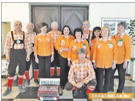
Хор "Ехо" празнува своята 35-годишнина през 2022-а. Сърцето на групата е съставено от арсеналци.

Трима действащи арсеналци тръпнат в очакване на големия концерт на 24-и март вечерта е едно от големите събития в годишната програма на групата.