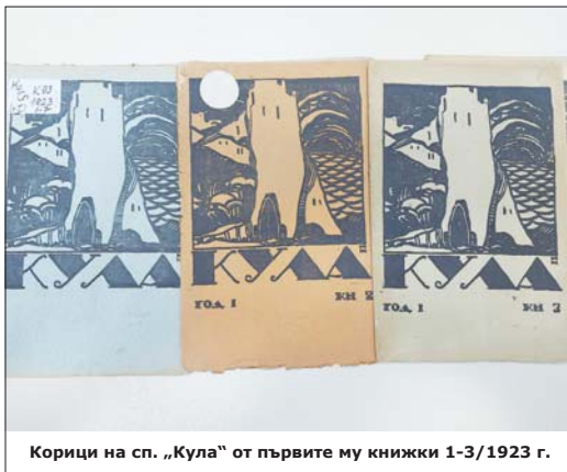
Корици на сп. „Кула“ от първите му книжки 1-3/1923 г.