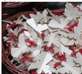
Коледни ангелчета, изработени в ДГ „Буратино“

„Благодарим Ви за изключително ценната подкрепа, човешчина и съпричастност към нашите пациенти и към общата ни болница. Ръка, която дава, не обеднява! Бъдете живи и здрави!“ се казва още в писмото.