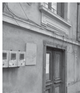
Къщата с паметната плоча на Тодора Бакърджиева в Казанлък вече е съборена

родния театър Катерина Златарева и големия български композитор Добри Христов. Интересна е линията към Петко Киряков - Капитан Петко Войвода. В своя дом във Варна през 1891 г. той става кум на венчавката на Тодора Бакърджиева с втория ѝ съпруг, актьорът Васил Кирков. Венчавките са две, женят се