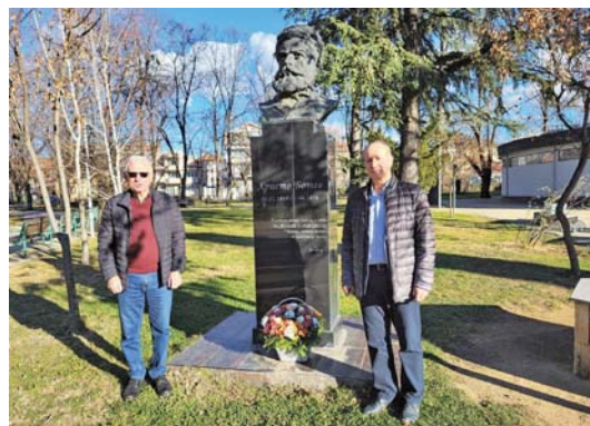
В деня на 175-ата годишнина от рождението на Христо Ботев „Арсенал“ и коалиция „Алтернативата на гражданите“ почетоха паметта на поета-революционер с поднасяне на цветя пред паметника му в Казанлък.