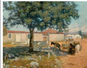
Пейзаж от Казанлък, 1919

Художник на детайла. Антон Митов бил общителен човек, обичал да е сред хора. Всеки ден привечер ходел до прочутата сладкарница „Панах“ на бул. „Дондуков“, обикалял тържищата, засядявал се пред джамията, около „Позитано“ и на Подуянкския пазар. Заставал крокото на едно място и внимателно се възирал в цветовете и формите. А после, с блестяща техника, зеленчуците, плодовете, облеклата на селянките, стоните, гърнетата и панциците оживявали в платната му. Прецизността му в пресъздаването на детайла била пословична, дори предизвиквала критики. Но именно този „фотографски“ рисунък донесъл слава на живописеца, оказал силно въздействие върху тогавашния български културен живот. „Селските“ му платна били посрещани с възторг и в повечето европейски държави, а той самият бил канен за изложби в техните сто-