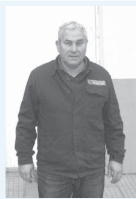
ме на трудолюбие, доброта и упоритост", признателен е днес синът.