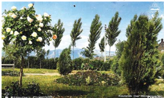
Розариум 1930 г. - архив Старъ Казанлък

хубава страна. Розите били пренесени от Фригия първо в Тракия и оттам в Македония, Гърция и другите части на Европа. В „Илиада“ е описано, че Персефона брала рози и лилии в Нисейското поле. А това омайно поле се намирало в Родопите. Една от приятелките на Персефона се казвала Родопе, като тази нимфа се възплътила във величествената тракийска планина, която до ден днешен носи името Родопе или Родопска планина. В основата на името Родопе стои гръцката дума от ирански произход „Родон“, с която старите гърци означавали розата.