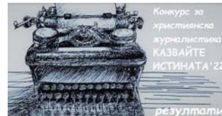
Конкурс за християнска журналистика „КАЗВАЙТЕ ИСТИНАТА“ '22 резултати