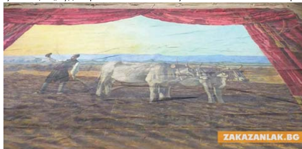
Театралната завеса, рисувана от Иван Енчев-Видю

реставраторът, за да не се погуби отново във времето. С обединените усилия на двамата „Орачът“ на Иван Енчев-Видю намира подслон, но и тук като че ли остава забра-