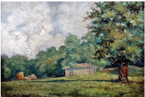
Пейзаж - 1917 г.

„Чудомир“ и започна работата по нейното реставриране. Проблемът бе, че, за да се съхрани занаят, тя трябва да бъде опъната като завеса, а не навита отново на руло.