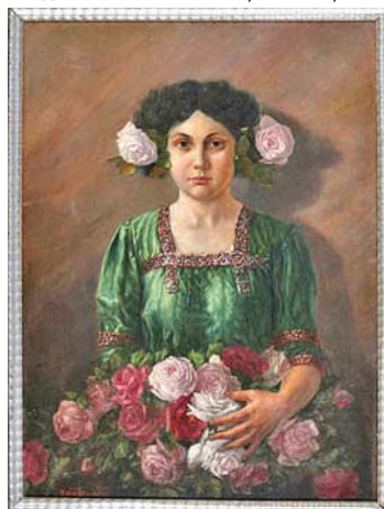
Розоберачка - 1908 г