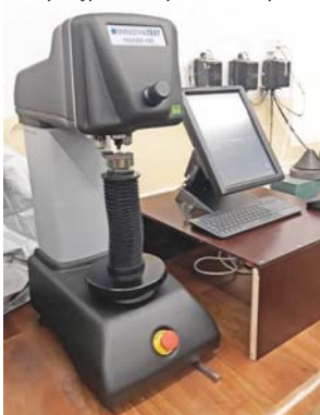
Апаратура за измерване на твърдост