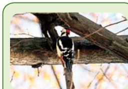
Пъстър кълвач в парка на „Арсенал“, сн. Искра Буюклиева