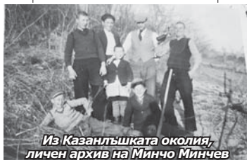
Из Казанлъшката околия, личен архив на Минчо Минчев

ни е била съставена от цели 47 населени места. Заемала