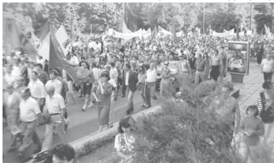
Арсеналци винаги са били сред най-активните в страната, защитавайки правата на работниците и служителите

Грижата за здравето в работещите в „Арсенал“ в последната година е основен приоритет. Болните се подпомагат не само финансово. Синдикатите се ангажират с осигуряване на помощ при настъпването в балнеосанаториуми от системата на НОИ, с участието в разпределението на работниците и служителите в безплатните смени за почивка на море в хотел „Арсенал“ в Несебър, с подпомагане организацията на профилактичните прегледи в предприятието, а напоследък – и с изготвянето на ваксинационния план за имунизация против Ковид-19. Цялата дейност по опазването на здравето