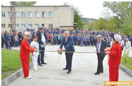
Откриване на обновения стол в Завод 4

доксално да изглежда, обектите за столово хранене в завода са били повече от ресторантите в град Казанлък. Социално-икономическите промени след 1989 г. бележат спад в производството, редуциране на персонала и съответно затваряне на много от тези обекти в „Арсенал“.