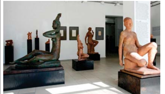
Галерия „Васка Емануилова“, основната експозиция

Галерията. След нейната смърт на ул. „6 септември“ е открита постоянна експозиция с творбите ѝ. През 90-те години обаче, поради реституция на имота, галерията била затворена. Предчествието на скулпторката се сбъднало. Срещу две „скапани“, според Светлин Русев, докоча чета Софийската община подарила огромна, модерно построена галерия. „Едно от най-достойните дарения, това на Васка Емануилова, изключителен творец и достоен човек, стана жертва на едно пладнешко безобразие, гримирано като реституция“, възмутил се Русев. Творбите били прибирани в депата на СГХГ, 12 години те били невидими за публиката. Няколко години имотът бил обитаван от наркомани, скитници и пияници. През 2006 г. личността и творчеството на Васка Емануилова обединили общинските съветници от всички партии и столичният Общински съвет взема решение да се намери друго място за галерията-филиал. То било намерено – 350 кв. м. на бул. „Янко Сакъзов“ 15, в центъра на София, близо до парково пространство с фонтан със скулптура на Емануилова. Музеят, макар и не много голям със своите 4 зали, преливащи една в друга, е с големи прозорци, с бронирани врата и добро хранилище, с климатична инсталация и чудесно осветле-