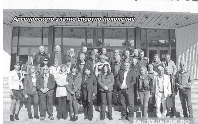
Арсеналското златно спортно поколение