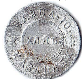
Жетон за хляб в „Арсенал“ – Завод 10 - 1948-1964

подготовката и обслужването по време на фирмения