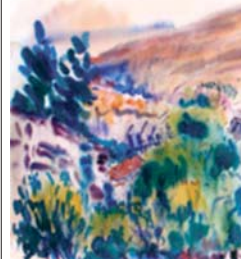
„Манастир – есента“, 1965

Творчеството. Като художничка със специфичен почерк в акварелите и рисунките си, Васка Емануилова имала интерес към природата, природата, бита на селския човек и християнските образи.