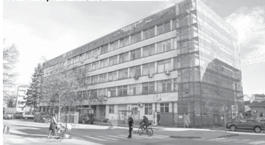
Започна ремонтът на Поликлиниката

подобряване на средата и условията на обслужването им.