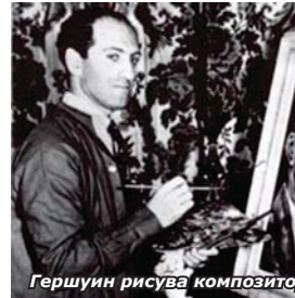
Гершунин рисува композитора Шостакович

Славата. Името му не слизало от вестниците. Знаменитият Рубинщайн съзрял в него „искра на гениалност“, бил уверен, че „Америка ще се гордее с него“. И това се случило - 25-годишен,