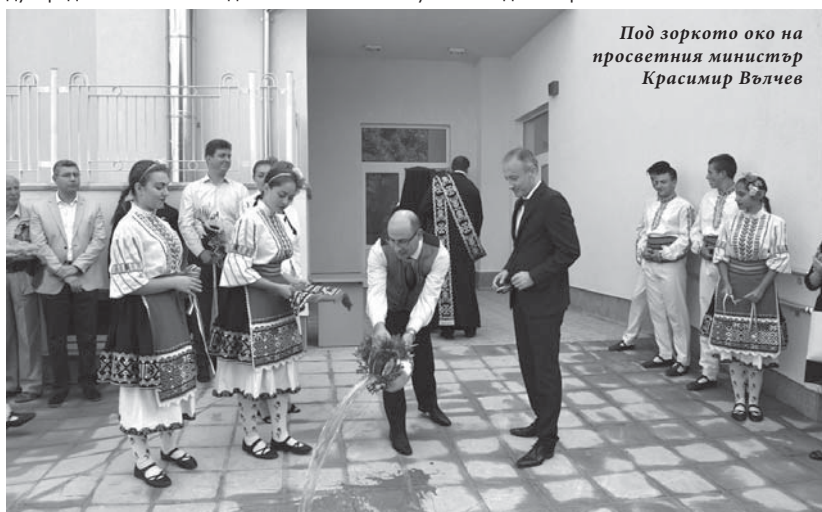
Под зоркото око на просветния министър Красимир Вълчев

има училището, но смятам, че е една достойна година, с отлични постижения. Малките ни ученици от 5, 6 и 7 клас доказаха, че като средно ниво са водещи в областта, както в колективните, така и в индивидуалните изяви, в олимпиадите на областните кръгове по математика, физика, български език, история, география. От гимназиалния курс до момента имаме трима лауреати на национални олимпиади - по български език и литература, по гражданско образование, имаме много достойно представяне на националните кръгове по почти всички предмети. Имаме отлични постижения на международно ниво. Тази година