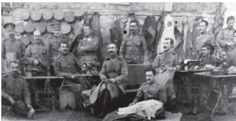
Полева оръжейна работилница в 81-ви Пехотен полк през Първата световна война

по изключително задълбочена програма от военното дело, одобрена от инспектора на артилерията. След завършване на обучението курсистите получават правото да кандидатстват за заемане на длъжности техник или пиротехник. Те се задължават да служат във въоръжените сили не по-малко от 4 години. Тази първа школа за кадри впоследствие се премества с дислоцирането на Софийския артилерийски арсенал в Казанлък. С годините тя се превръща в ковачница на високо-