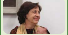
Желязната лейди: Ренета Инджова