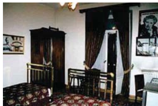
Стаята в Pera Palace

Българската връзка. Най-известния си роман - „Убийство в Ориент Експрес“, 1934 г., създала след срещата си с един българин. Написала го в Истанбул, в хотел „Пера Палас“ в стая 411, която днес не носи номер, а име - „Стаята на Агата Кристи“.