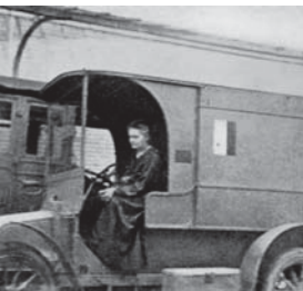
Първата мобилна рентгенова лаборатория на М. Кюри

вела експерименти за лекуване на ракови клетки с източници на лъчение. Основала Радиев институт и във Варшава. По време на Първата световна война, заедно с Ирен, Мария Кюри организираща 220 стационарни и подвижни рентгенови лаборатории за преглед на ранени войници, от чиято