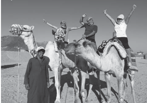
С фамилията в Египет

най-осезателно се чувства движението на „Арсенал“ напред. „Тук се влагат много средства и в производството, и в социалната сфера. Работещите чувстват сигурност и увереност. Такова спокойствие за утрешния ден никога не е било. Което е и една от причините нещата да вървят добре“.