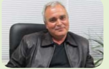
Аверът на Джани Моранди в „Арсенал“