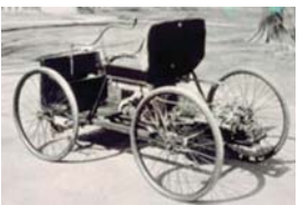
Квадрациклетът на Форд

Квадрациклетът. От 1891 г., след обучението си, 8 години Форд работи като инженер-механик и главен инженер в Електрическата компания на Томас Едисон. На 32 г. вече е конструирал собствен автомобил – квадрациклетът. Името идва от четирите задвижващи го колела. Създава го върху дървена кухненска маса в работилничката в двора на къщата си. Колата е едноместна, скоростната кутия е с две предавки – за 16 и 32 км/ч, без задна скорост. Задвижва се с верига. Резервоарът е под седалката, побира 11 л. бензин.