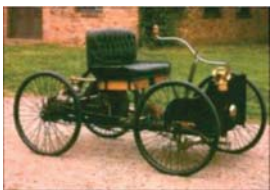
Първият Model A Fordmobil

цена $1200, с няколко версии на купелте, вкл. кабриолет, спортно купе, ликап и такси. От него са продадени почти 5 млн. броя.