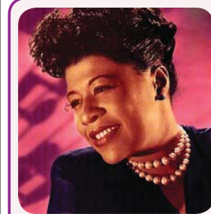
През 2017 г. се навършват 100 г. от рождението на легендарната певица.

добродушната Ела, тя никога не се изживявала като идол. Последния си диск „AllThatJazz“ записва през 1989 г. Един от последните й триумфални концерти е с биг-банд на Каунт Бейси в Лондон през 1990 г. Тя събира сили за прощалния си 4-часов концерт в Карнеги хол през 1991 г. Получавайки „Грами“ през с. г., се усмихвала през съзлзи – съзнавала, че това отличие е за минали отговори. На журналистите отговаряла: „Сама съм. По-добре сама, отколкото да се чувствам грозно за човека, пред когото бих искала да съм хубава“. И не пропускала да благодари на публиката: „Щом хиляди хора ме слушат и досега, значи всичко, което съм направила, действително си заслужава!“