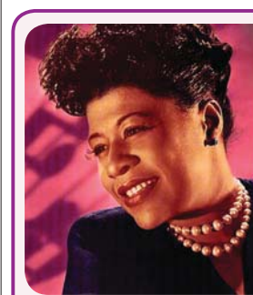
През 2017 г. се навършват 100 г. от рождението на легендарната певица.

тя. На музикалния небосклон изгряла нова звезда. Първият й запис бил за изгубената чантичка, а когато всички започнали да си я тананикат, тя записала „Намерих си чантичката“.