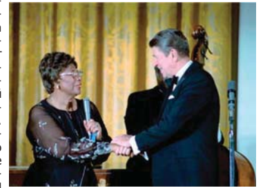
С президента Роналд Рейгън в Белия дом, 1981

Сама съм. Въпреки че са шедевори, концертите и звукозаписите ѝ ставали по-редки. Славата не променила