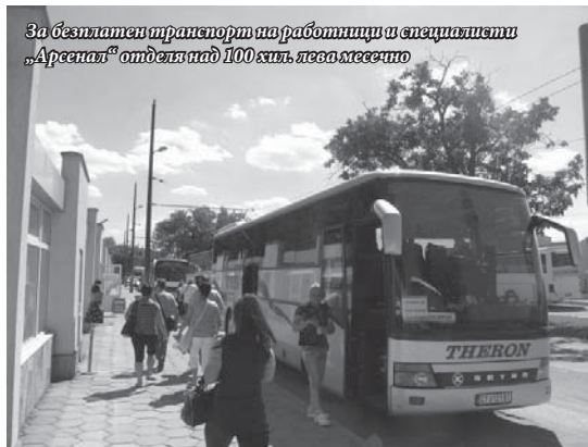
За безплатен транспорт на работници и специалисти „Арсенал“ отделя над 100 хил. лева месечно

Анализът на работното време показва, че всеки ден, поради болнични средно от „Арсенал“ отсъстват близо 350 души. Това сочат данните за първите 4 месеца на тази година. Работодателят заплаща само първите три дни от болничните, но изразени в пари, тези отсъствия по болест предста-