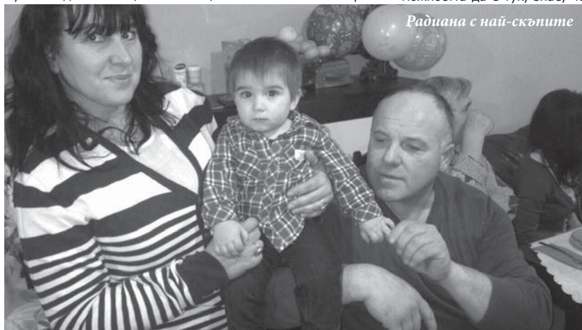
Радиана с най-скъпите

и, без да се надявам на конкретна сума или награда, си мислех за този момент - разказва късметликата от града на розите. Но, когато наистина се случи, не можах да повярвам. Ето, така е устроен човек.“