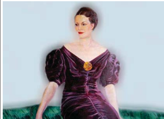
Портрет на Елисавета Багряна – художник Иван Табаков

Вапцаров. Ролята на Багряна в процеса срещу поета е една от най-спорните точки в нейната биография. Дали тя е можела да го спаси и доколко нейните и на другите свидетели показания са имали значение или съдбата на арестуваните е била вече решена, са въпроси без еднозначен отговор. Едно е ясно – на 23-ти юли 1942 г. Никола Вапцаров, заедно с петима свои другари, е разстрелян.