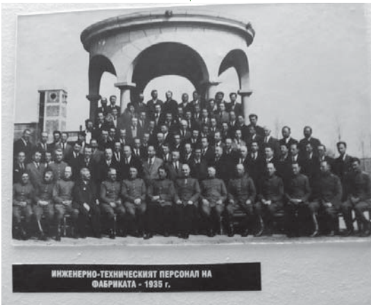
ИНЖЕНЕРНО-ТЕХНИЧЕСКИЯТ ПЕРСОНАЛ НА ФАБРИКАТА - 1935 г.

занлък през 1924 година е свързано не само със строителството и оборудването на цехове и работилници, но и с изграждането на собствено водозахранване. Всъщност, едно от условията за избиране на място за новата фабри-