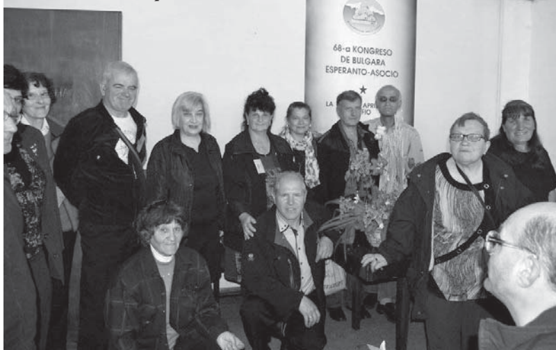
Митко с колеги есперантисти

Есперанто (Esperanto) е най-разпространеният изкуствен международен спомогателен език. Първоначалното име на езика е Internacia Lingvo , а днешното му наименование идва от Doktoro Esperanto , псевдонимът, под който полският филолог Людвик Заменхоф публикува в „Първа книга“ първото описание на новия език, издадена през 1887 година.