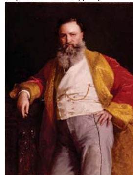
Портрет на Исаак Сингер от Едуард Мей, 1869

Скандалният личен живот. Хората познавали Сингер, не само заради гениалните му хрумвания, а и заради фриволния му начин на живот. Той изобщо не покривал стереотипа на изобретател-бизнесмен - не бил суховат интелгент с очила, седящ денонощно зад бюрото си. Бил представителна и колоритна личност, жизнерадостен гигант, истински изпълнен - висок 193 см. За своите 63 години живот покорил огромен брой женски сърца. Виждали из Сен-