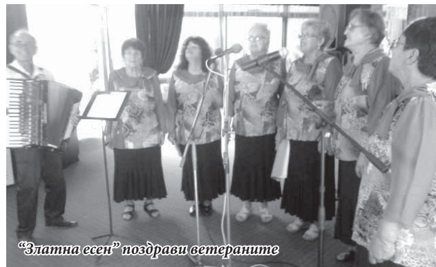
„Златна есен“ поздравии ветераните

със свежия призив за танц към побелелите коси на ветераните: „Дами канят!“.