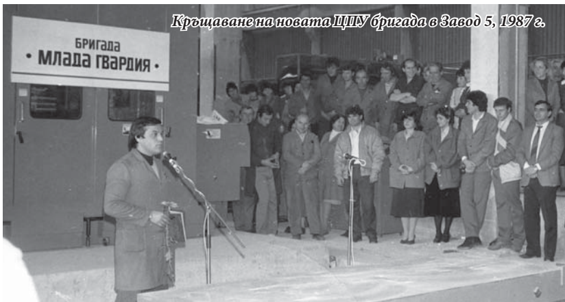
Кръгъване на новата ЦПУ бригада в Завод 5, 1987 г.

Вечер след работа радостта му е да се чуе по телефона