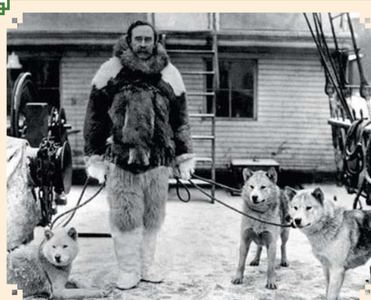
През 2016 г. се навършват 160 г. от рождението на именития полярен изследовател.