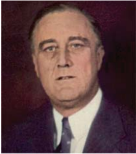
Франклин Делано Рузвелт

Мисис Рузвелт. От нея се заинтересувал далечният ѝ родственик Франклин, студент по право с приятна външност. И двамата живо се вълнували от обществени и политически проблеми. В задушните им беседи Елинор била особено обаятелна. През 1903 г. тя решително му отговорила с „Да“. Сватбата се превърнала в голямо събитие, охранявано от 75 полицаи - с 200 гости и 340 подаръка. До олтара я отвел чичо ѝ Теодор Рузвелт. Сватбеното им пътешествие включвало Италия, Франция, Германия, Швейцария и Шотландия. Родили им се 6 деца - една дъщеря и петима синове, единият от които починал на 8 месеца.